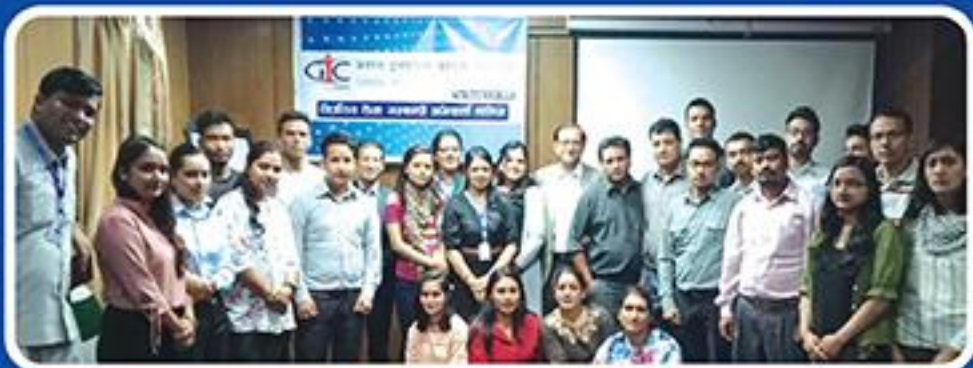
वीजा सम्बन्धि अभिकर्ता तालिम