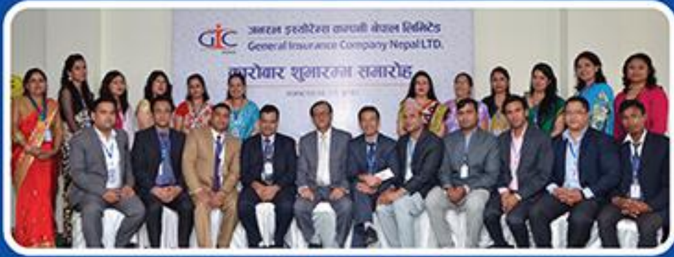
कारोवार शुभारम्भ समारोह